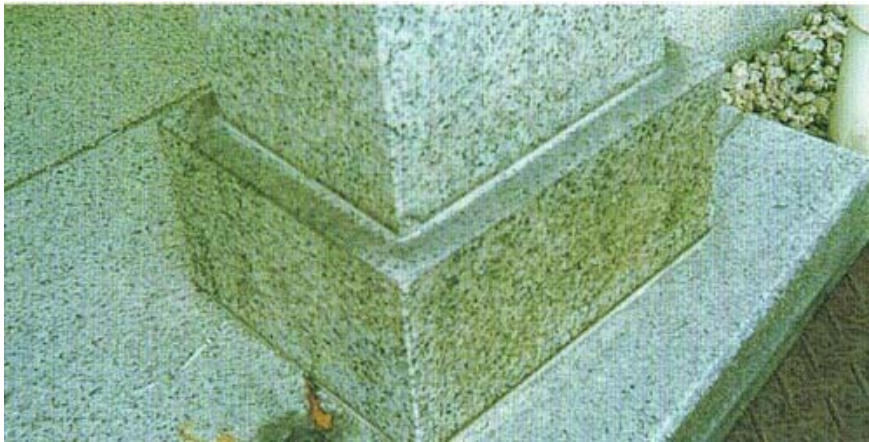
▲お墓クリーニング前

A 建て替え・リフォームもできますが、まずはクリーニングをされることをおすすめします。 一度きれいにしたあと、5年に1度クリーニングされると、常に新調されたような状態を保てます。