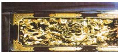
▲御仏壇クリーニング後