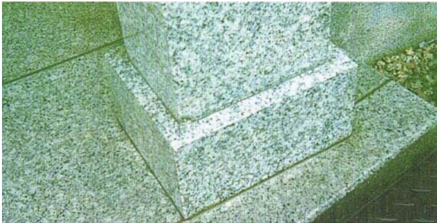
▲お墓クリーニング後