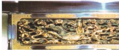
▲御仏壇クリーニング前

分解や輸送の手間と時間もなく、ご自宅に安置のまま即日クリーニングができますので、お気軽にご相談いただければと思います。